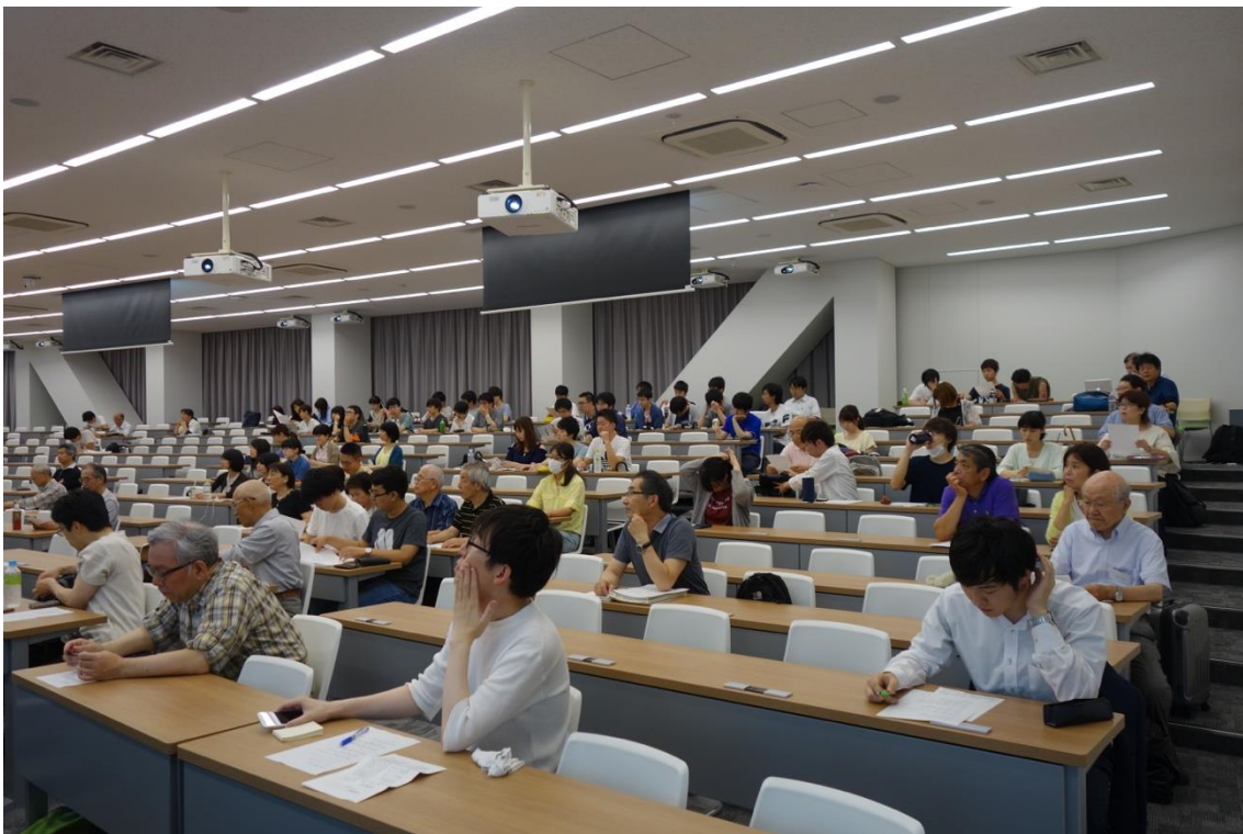
写真4 100人を超える参加者を集めた今回の例会